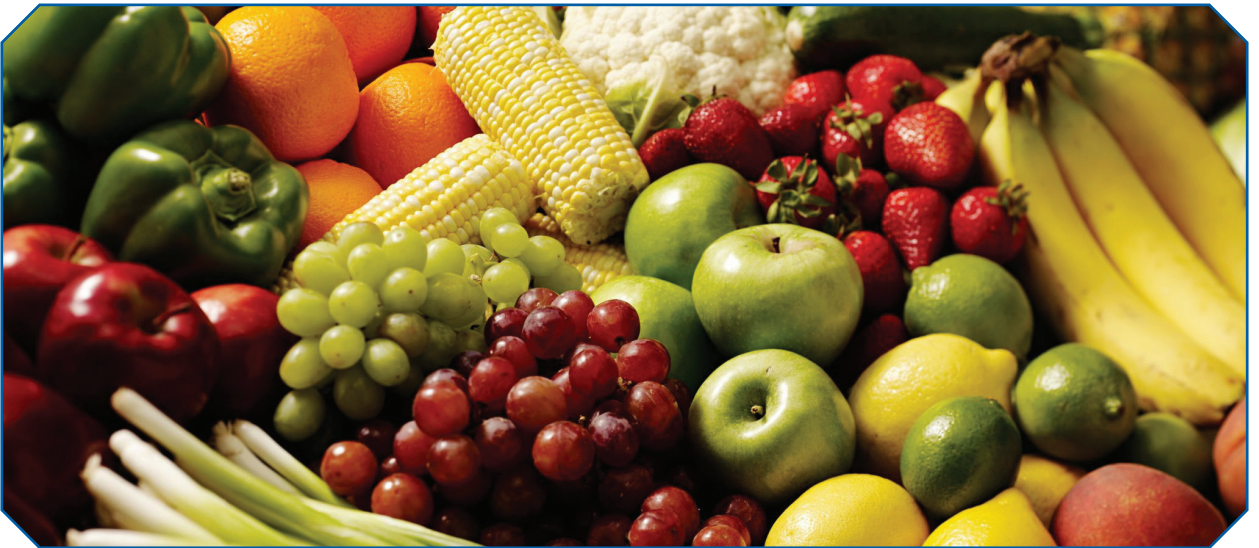
Görsel 29: Helal daresi, harama ihtiyaç hissettirmeyecek kadar geniştir.

Dinimizde herhangi bir konuda helal ve haram koyma yetkisi yalnızca Yüce Allah'a ve O'nun elçisi Hz. Peygambere aittir. Bu nedenle helal ve haramlarla ilgili temel kaynaklarımız Allah'ın (c.c.) kelamı olan Kur'an-ı Kerim ile Allah (c.c.) Resulünün sünnetidir.