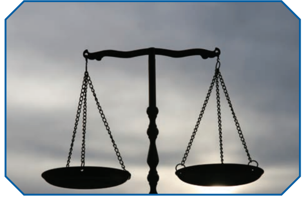
Görsel 31: İslam hukukuna göre suç ve ceza arasında denge olması gerekir.

Suçun niteliğini belirleyen bazı unsurlar vardır. Örneğin suç işleyen kişinin çocuk olması ile yetişkin olması; ruhsal sağlığının yerinde olması ile akli dengesinin bozuk olması gibi durumlar suçun karşılığı olan cezanın niteliğini değiştirir. Suç kabul edilen fiilin bir saldırı olması ile bir müdafanın gereği olması da yine suçun niteliğini belirleyen unsurlardandır. Suçtan doğan zararın boyutu da suç hakkında hüküm verirken önemlidir. Zararın boyutu, telafi edilebilirliği, bireysel veya kamusal boyutu suçun niteliğini etkiler. Örneğin bir suç, kamusal boyutta bir zarara yol açmışsa cezası daha fazla olur. Yine suçu işleyen kişinin niyeti de suçun niteliğini belirlemek açısından göz önünde bulundurulması gereken hususlardandır. Kişinin, suçu kasıtlı olarak işlemesi ile dikkatsizlik veya kontrolsüzlük sonucu gerçekleştirilmesi, belirlecek cezayı da değiştirecektir.