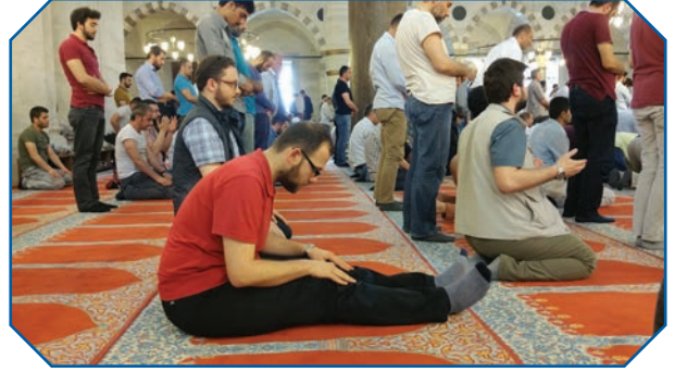
Görsel 28: Bireyin özel şartları, mükellefiyetin sınırlarını belirler.

Yüce Allah kullarını yaratan varlık olarak, aynı zamanda onları en iyi şekilde tanıyandır. Bu nedenle kulun gücünün sınırlarını gözeteerek teklifte bulunur. Dinimizde mükellefin durumuna göre emir ve yasaklarda kolaylık ve güç yetirebilirlik ilkesi esas alınır. Yüce Allah bu konuda “... Din hususunda sizin üzerinize hiçbir zorluk yükledi... ” 3 buyurmuştur. Yine konuyla ilgili olarak Yüce Allah, “ Allah her şahsı, ancak gücünün yettiği ölçüde mükellef kılar. Herkesin kazandığı (hayır) kendine, yapacağı (şer) de kendinedir... ” 4 buyurmuştur. Ayrıca Hz. Peygamber, “ Kolaylaştırınız, zorlaştırmayınız, müjdeleyiniz, nefret ettirmeyiniz. ” 5 buyurarak dinimizde gerekli hususlardaki kolaylığa vurgu yapmıştır.