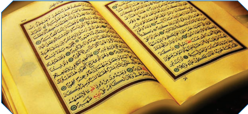
Görsel 27: Kur'an-ı Kerim İslam Hukuku'nun temel kaynağıdır.

Fıkıhın, teorik ve metodolojik yönünü ifade eden fıkıh usulünün yanında, günlük hayattaki yansımalarına bakan bir yönü de vardır. Günlük hayatın pratik kısmı ile ilgilenen bu ilme ise füruat adı verilir. Fıkıh disiplini bir ağaca benzetilirse; fıkıh usulü kökler ve gövdeye, füruat ise dallara benzetilebilir.