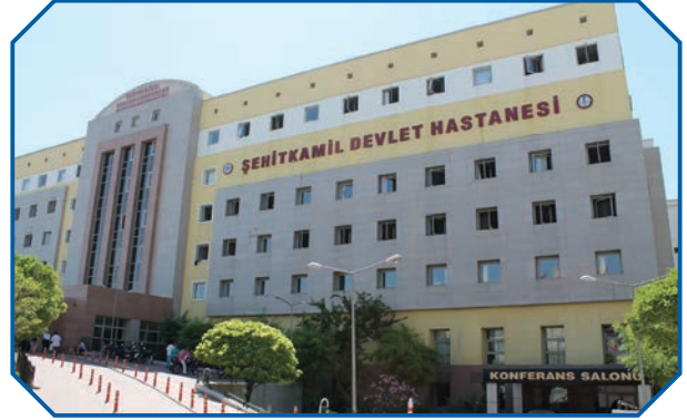
Görsel 32: Kamu yararını tesis için büyük yatırımlar yapılır.

Bireysel hakları kullanırken ve sorumlulukları yerine getirirken kamu yararı gözetilmelidir. Bireysel menfaat ile kamu menfaati çatıştığında, kişilerden kamu yararına göre hareket etmesi beklenir. Ancak bunu yaparken bireysel haklar da gözetilmelidir. Örneğin bir yerleşim yerinde ihtiyaç duyulan yol, hastane ve okul gibi bir kamu hizmetinin gerçekleştirilebilmesi için gerekli olan arazi özel mülkiyetse, bedelinin kişiye devlet tarafından ödenmesi suretiyle kamulaştırılması gerekir. Böylece bireysel haklar da korunarak kamu yararı gözetilmiş olur.