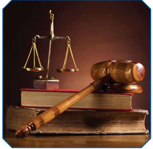
Görsel 30 Adalet mülkün temelidir.

Bireyin içinde yaşadığı toplumda kendi hak ve sorumluluklarının gereğini yerine getirebilmesi, insanlar arasındaki ilişkileri düzenleyen kurallar sayesinde mümkündür. Bu kurallar bireyleri koruyan, eşitlikçi ve adil nitelikte olmalıdır. İnsanlar arası anlaşmazlıklarda, sorunun çözümü için bireysel kanaatler veya yöntemler değil, hukuki yollar kullanılmalıdır. Örneğin Hz. Peygamber, yaşadığı toplumun yanlış bir uygulaması olan kan davalarını kaldırmıştır. Kan davalarının yasaklanmasının muhtelif sebepleri olmakla beraber, temelde bireylerce gerçekleştirilen kanunsuz cezalandırmanın önüne geçilmek amaçlanmıştır.